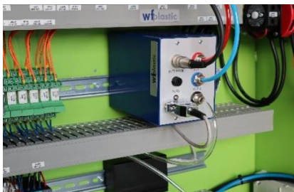
Abbildung: Nozzle Melt Monitor

Der NMM funktioniert ohne Einstellarbeiten und ist einfach in den Schaltschrank zu setzen. So braucht der Monitor keinen zusätzlichen Platz an der Maschine: